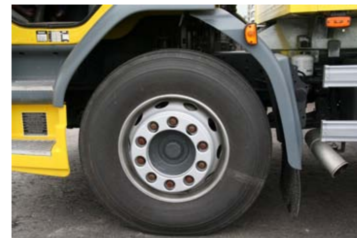
Такие колёса, по мнению ЛЕЙЛАНД-ДАФ, больше подойдут среднетоннажнику

не перестаёт вызывать некоторые смешанные чувства: с одной стороны очень нетрадиционное, несколько даже шокирующее решение, а с другой производитель буквально трубит – «смотрите как легко и просто можно управлять нашим 10-тонным грузовиком, одно движение, и шестиступенчатая трансмиссия сама разберётся с выбором передачи, а вам остаётся только задать нужное направление движения». А об условиях труда водителя компания DAF или Leyland, или они вместе, позаботились не слабо. Кожаная отделка рулевого колеса, на которое вынесены кнопки управления бортовым компьютером, одноступенчатым ретардером и мобильным телефоном, подключаемым через свою гарнитуру, очень удобное сиденье водителя, множество ниш для мелких вещей, 12-вольтовый разъём бортового питания, дополнительное сферическое зеркало для обзора перед носом автомобиля, само собой разумеется – электростеклоподъёмники... В общем, если на время забыть о весогабаритных параметрах, то ощущаешь себя как в хорошем легковом автомобиле, наверное, почти «Ягуа-