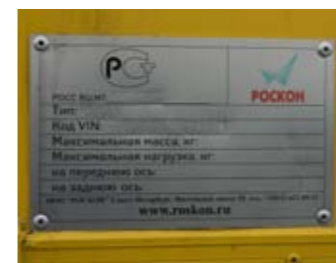
Фургон – родом из России

продукция нам пока в диковинку, чем искренне меня и заинтересовала. Первое внешнее отличие «англичанина с голландской пропиской» от правящих бал на наших дорогах «японцев» и «корейцев», нельзя не заметить – колёса радиусом 22,5 дюйма, обутое в шины размерностью 295/80 R22,5. Трудно сделать какие-либо выводы, касающиеся топливной экономичности без соответствующих замеров, но грузоподъёмный потенциал шасси в этом случае сомнению не подлежит. Уверенности добавляет двигатель Cummins, рабочим объёмом 6,7 л и мощностью 300 л.с. Экологический класс Euro 5 достигается применением технологии AdBlue –