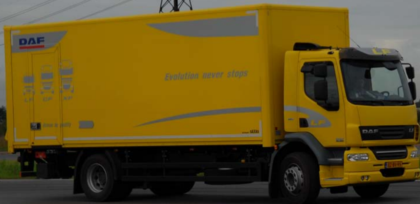
Грузовик на кольцевой гоночной трассе смотрится эпически!